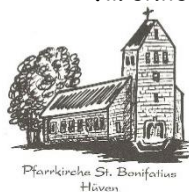
Pfarrkirche St. Bonifatius Hüven