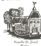
Kapelle St. Josef Eisten